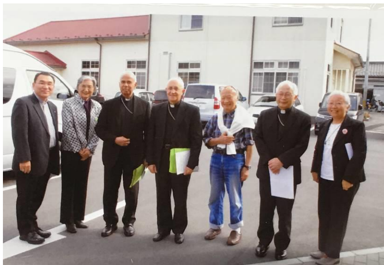
フェルナンド・フィローニ枢機卿（写真中央）とカリタス南相馬敷地内にて。